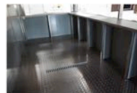
Amenagement interieur. bonde sol.