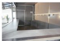
Espace interieur. Rack de prises