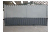
securite en position fermée